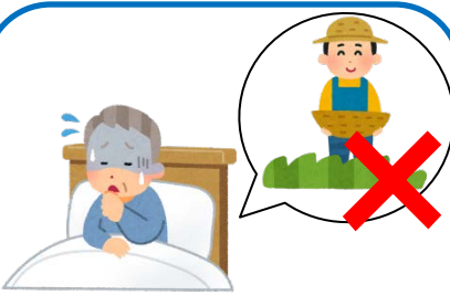
病気やケガで収穫ができない場合