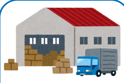
保管中に事故が生じた場合